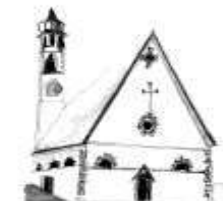
Parrocchia di Mezzano