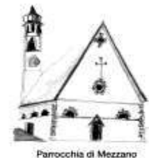
Parrocchia di Mezzano

Piazza della Chiesa, 3 38050 Imèr (TN) Telefax: 0439.67087 Don Nicola: 348.6714592 imer@parrocchietn.it www.decanatodiprimiero.it