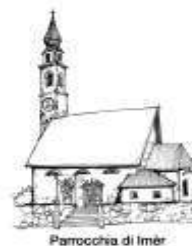
Parrocchia di Imèr

Unità Pastorale “Santi Pietro e Paolo e San Giorgio”