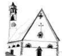
Parrocchia di Mezzano

Piazza della Chiesa, 3 38050 Imèr (TN) Telefax: 0439.67087 Don Nicola: 348.6714592 imer@parrocchietn.it www.decanatodiprimiero.it