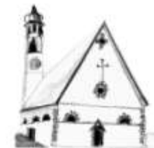
Parrocchia di Mezzano

imer@parrocchietn.it - www.parrocchieprimierovanoi.it