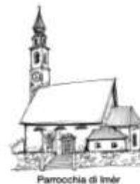
Parrocchia di Imèr