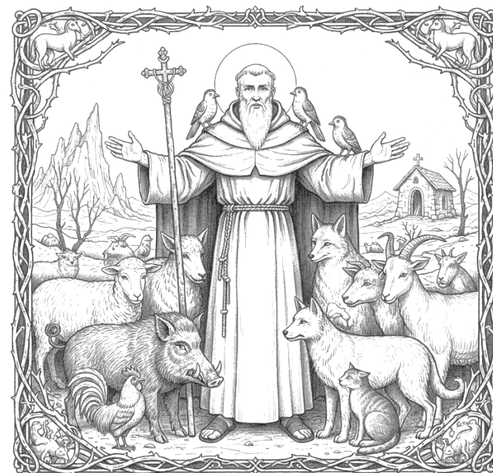
SANCTUS ANTONIUS ABBAS ANIMALIUM PATRONUS

con la tradizionale benedizione del sale e dei mezzi agricoli