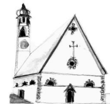
Parrocchia di Mezzano

imer@parrocchietn.it - www.parrocchieprimerovanoi.it