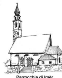
Parrocchia di Imèr